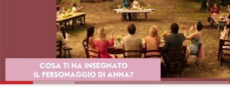
COLA TRINA: IL PERSONAGGIO DI ANNA?