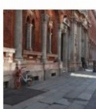
CRONACHE Coronavirus, scuole chiuse in tutta Italia fino al 15 marzo