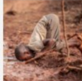
FOTO Le più belle foto del 2019 dedicate al Pianeta