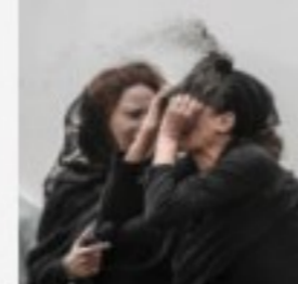
FOTO World Press Photo 2020, le foto finaliste