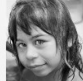
STORIE «Figlia mia, la tua malattia non ti ha fermato»