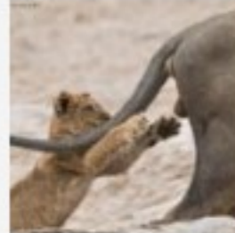
FOTO Tutte le immagini degli animali che ci fanno ridere