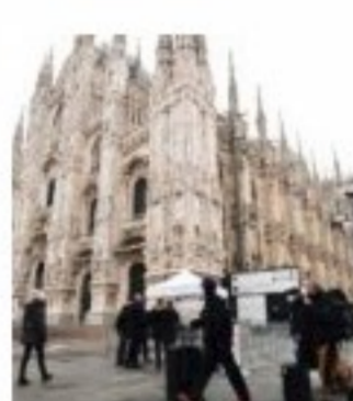
CRONACHE Coronavirus: meno contagi e più guariti. I numeri però restano alti