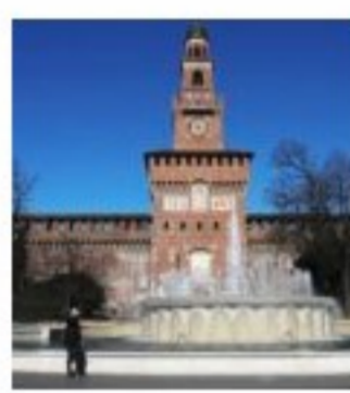
CRONACHE Coronavirus, settimana decisiva. L'ordinanza: cosa riapre e cosa no

La Cina ferma le feste per il Capodanno, la maggiore delle festività del calendario lunare. Fa paura la diffusione del coronavirus